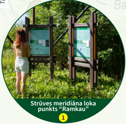
Strūves meridiāna loka punkts "Rāmkau" 1