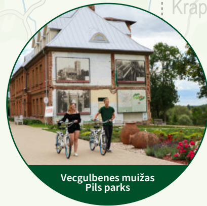
Vecgulbenes muižas Pils parks