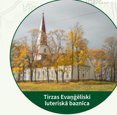
Tīzas evaņģēliski luteriskā baznīca