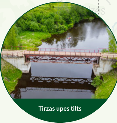
Tirzas upes tilts