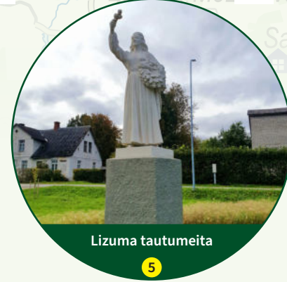
Lizuma tautumeita 5