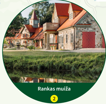
Rankas muiža 2