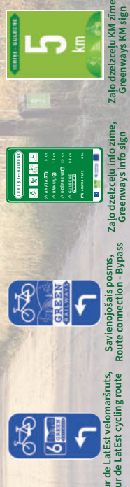
Tour de Latēst velomašrūts, Savienojošais posms, Route connection - Bypass Zaļo dzelzceļu info zīme, Greenways info sign