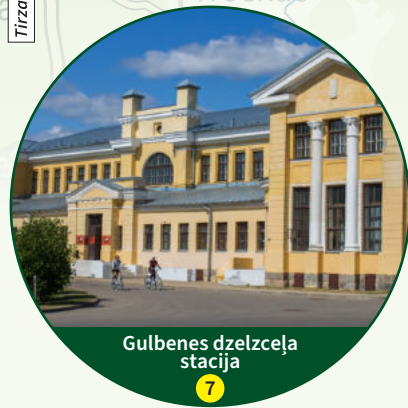
Gulbenes dzelzceļa stacija