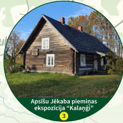
Apsīšu Jēkaba piemiņas ekspozīcija "Kalaņģi" 3