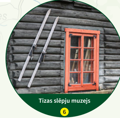
Tīzas slēpju muzejs 6