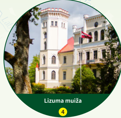
Lizuma muiža 4